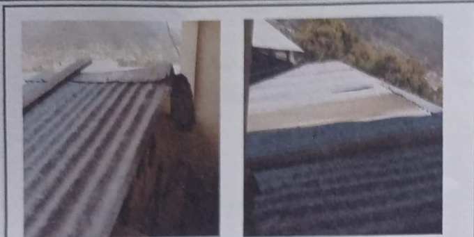
Foto1: Cubierta de Lámina